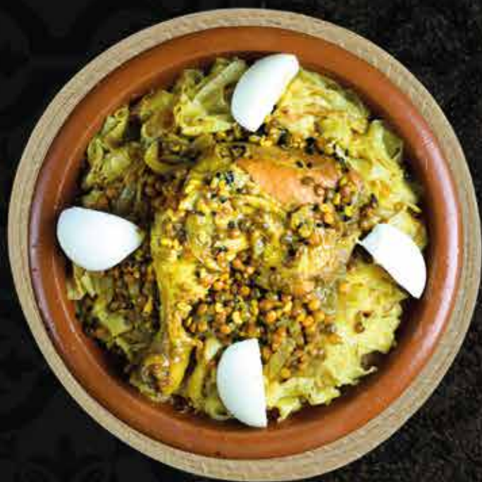
Rfissa Plat du Lundi