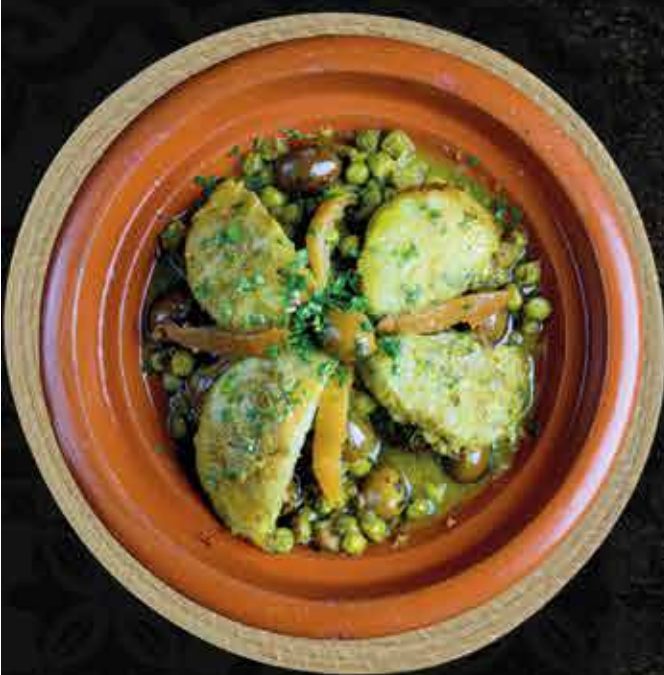
Tajine du chef Plat du Mercredi